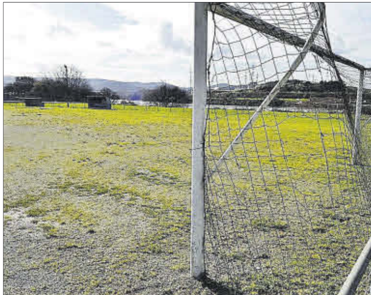
Campo de fútbol de Rañobre.