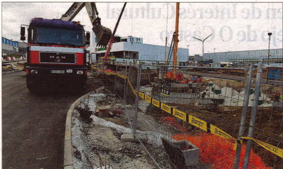
Obras en el complejo comercial de Nexus Sabón. // Víctor Echave